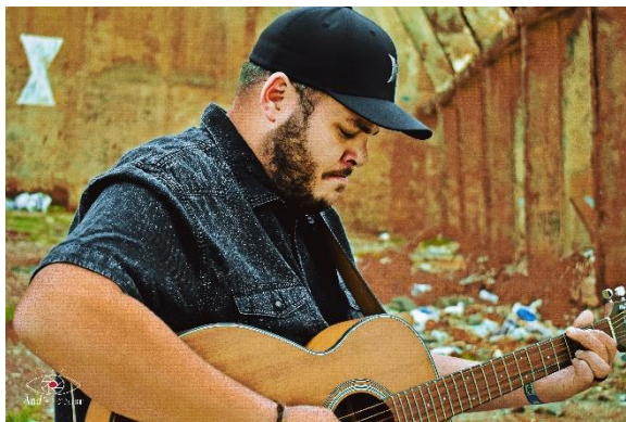
CANTAUTOR, MÚSICO, EDUCADOR Y CREATIVO